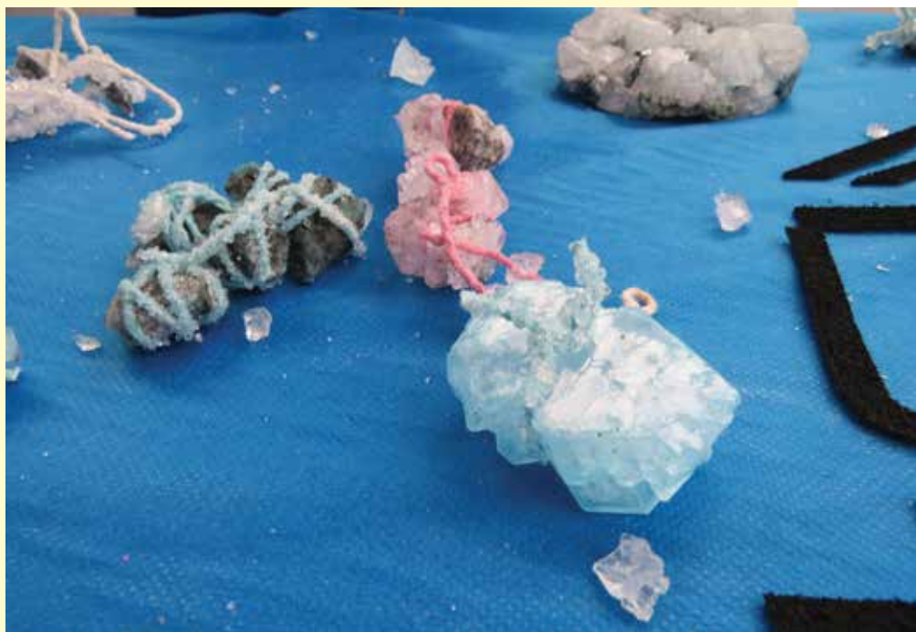
Na Feira, alunos do Moppe mostraram suas descobertas sobre os cristais

dos cristais espontaneamente na natureza e, mais tarde, experimentos em laboratório com açúcar e